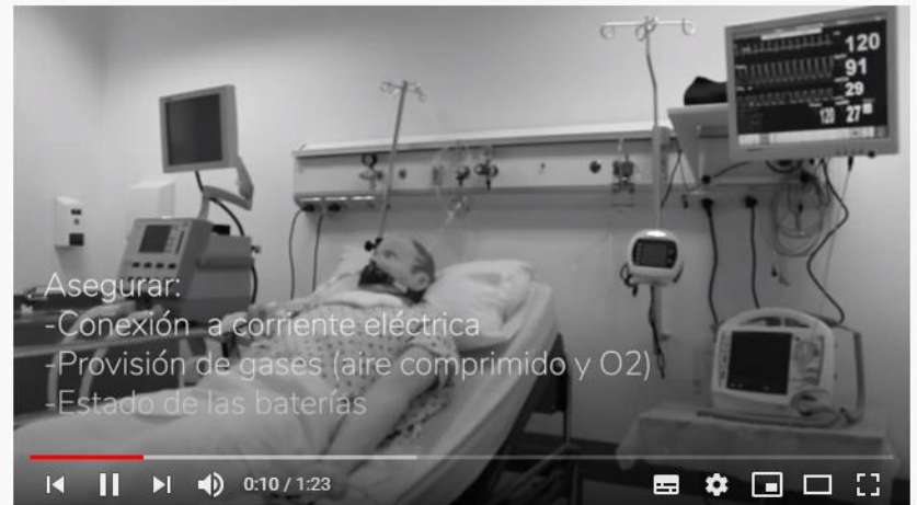
Puesta en marcha del ventilador mecánico

Los materiales están realizados en base a la mejor evidencia disponible al momento, adaptada a la realidad y necesidad nacional, focalizados en la protección del personal de salud y la identificación, diagnóstico, prevención, notificación y asistencia de pacientes en el contexto de COVID-19.