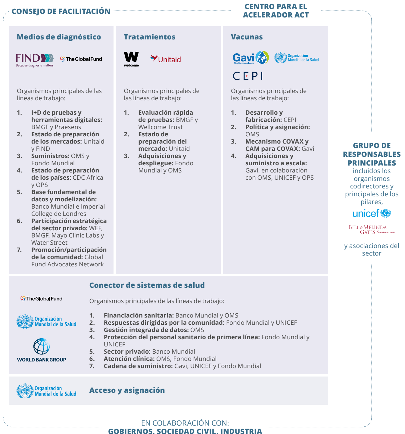
Figura 2 - Estructura del Acelerador ACT, con los organismos codirectores y principales de los pilares