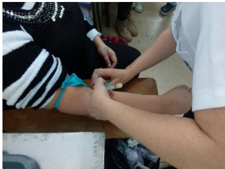
Simulación con paciente simulado