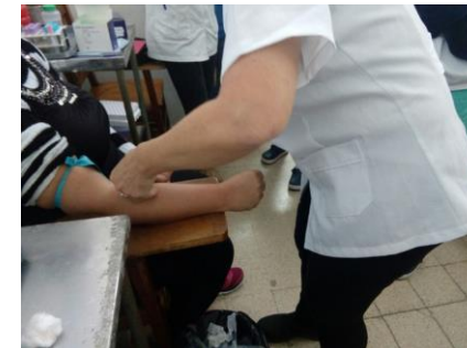
Tecnica de punción en brazo