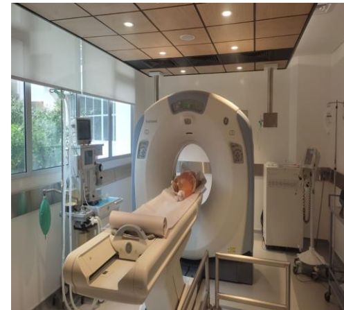
Experiencias simulación alta complejidad – EUTM