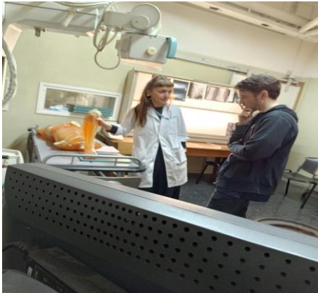
Simulación radiológica – EUTM