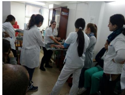
Tecnica de extracción en bebés